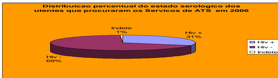
Gráfico 1. Seropositividade em 2006

Dos utentes testados nos serviços de ATS em 2006, 31% acusaram HIV positivo, enquanto que 68% conheceu o resultado negativo. Desse número apenas 1% teve resultado indeterminado, ou seja, não teve oportunidade de conhecer a sua serologia em relação ao HIV. A tabela abaixo mostra o número de utentes que tiveram resultado positivo do teste de HIV por região. A conclusão da leitura feita sobre prevalência do HIV, em termos relativos pode-se ver no gráfico 7.